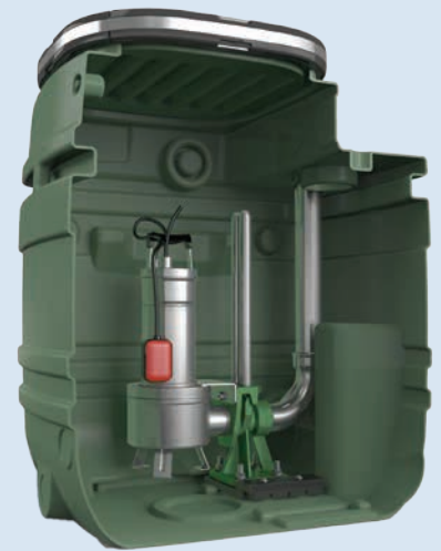
Automatische pompinstallatie Type BG1000