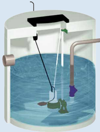
Betonnen pompinstallatie Type P1000