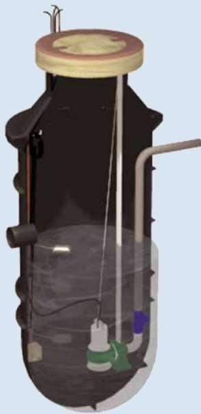
HDPE pompinstallatie Type PEV1000