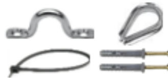
Afbeelding 6. Installatie benodigheden