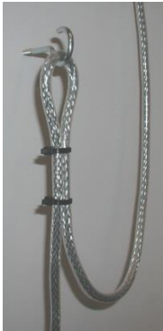
Afbeelding 6.1. Installatie van kabel

Indien de kabel verlengd moet worden en er is sprake van een equipotentiaal aarde, dient dit gedaan te worden met de kabelverbinder. De bekabeling tussen de OILSET-010 controle unit en de kabelverbinder dient gedaan te worden met een "sensor extension cable" instrument kabel.